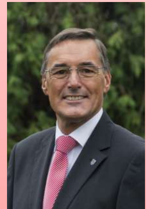
Ludwig Delt Bürgermeister