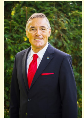
Ludwig Deltl Bürgermeister