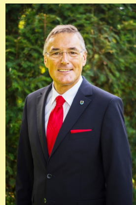
Ludwig Deltl Bürgermeister

Ich freue mich, dass das Projekt vom Land Niederösterreich unterstützt wird, denn für Strasshof ist die Denkmallokomotive nicht wegzudenken und unser Wahrzeichen wird dann auch nachhaltig gegen Witterungseinflüsse geschützt.